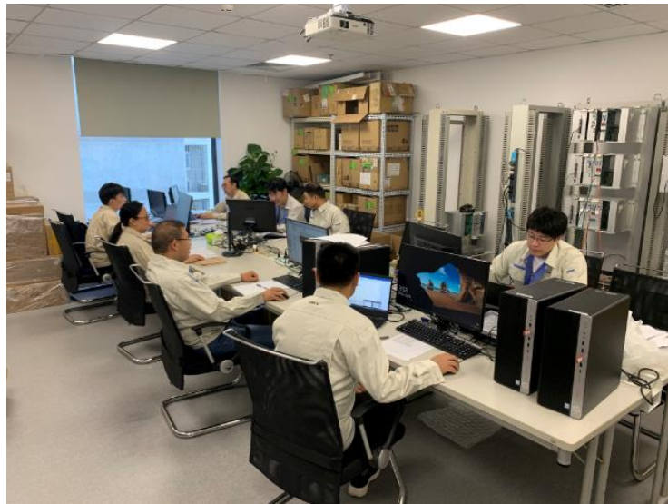
TMEiC 中国柳钢实验室团队

该项目是 TMEiC 中国负责的首条完整的热轧生产线系统，为客户提供包括从项目管理、工程设计、车间测试、现场启动直至项目管理的全方位支持。TMEiC 中国技术团队克服了新冠疫情期间的重重困难，成功应对了合同要求的 18 个月内首卷下线的挑战。