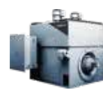
超高速、大容量电机